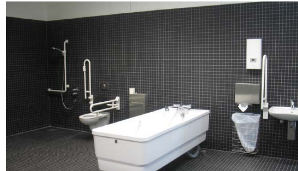
Badezimmer für Station